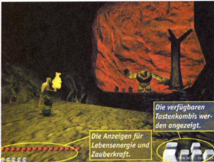
Die verfügbaren Tastenkombis werden angezeigt.