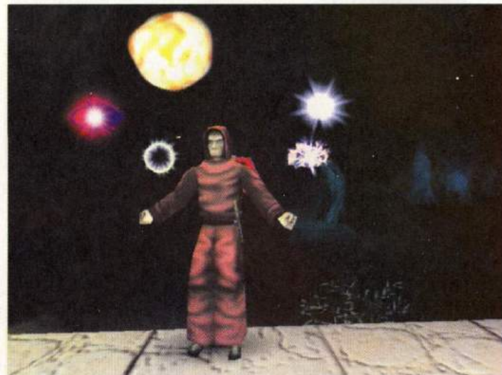
Sie bekommen, was Sie sehen! Zur Auswahl des Zauberspruchs rollen Sie in diesem „Menü“ den entsprechenden Magieeffekt nach vorn.

Angriffs von Orkscharen erwehren, die Waffenproduktion läuft auf Hochtouren. Die Erze dazu liefert eine riesige Strafkolonie, die allerdings völlig ohne Wachen auskommt. Der Grund: Eine magische Barriere umschließt den gesamten Knast, lebende Kreaturen können zwar in die Kolonie hineingelangen, sind dann aber auf ewig ge-