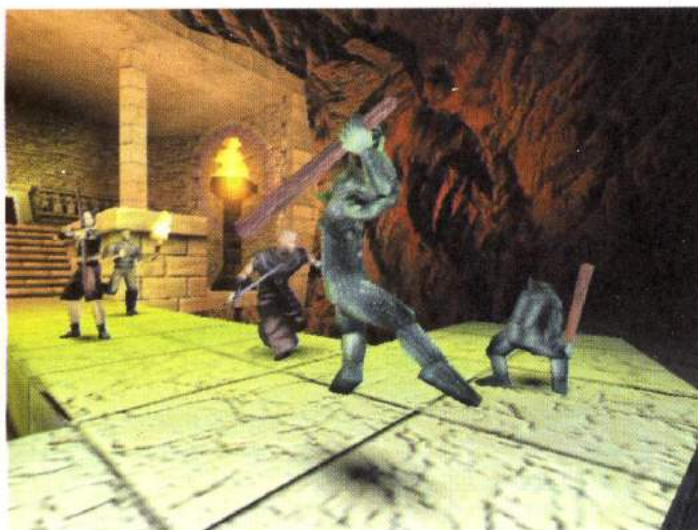
Diese echsenähnlichen Kreaturen haben gegen die zusammenarbeitende Dreiergruppe keine Chance. Hat den Viechern das niemand gesagt?

Die Charakterentwicklung erfolgt jedoch ohne genretypische Zahlenspielerereien. Sie ergattern ein Schwert? Gut, doch am Anfang werden Sie damit herumhacken wie ein Bauer mit seinem Pflug. Wenn Sie allerdings die Fähigkeit Schwertkampf erlernt haben, werden Sie bei Ihrem Helden wesentlich geschmeidigere Animationen feststellen. Piranha Bytes setzt bei Gothic voll auf das optische