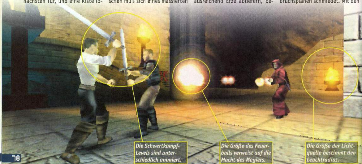
Die Schwertkampf-Levels sind unterschiedlich animiert.